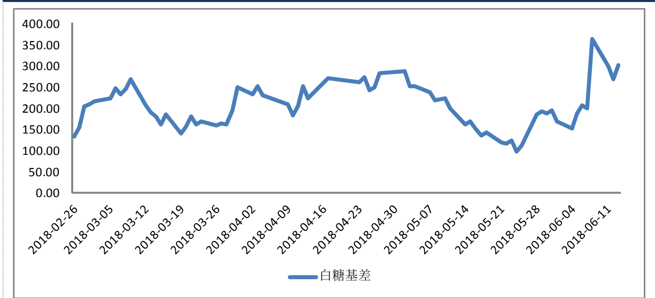
图一：白糖基差（元/吨）