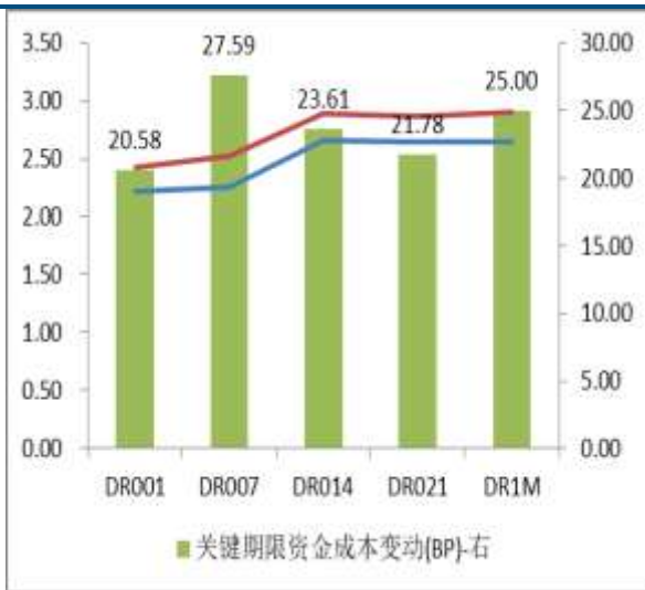
图 2：关键期限资金成本变动