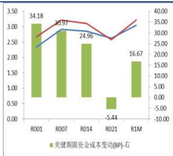
图 3：关键期限资金成本变动