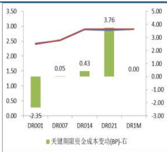
图 2：关键期限资金成本变动