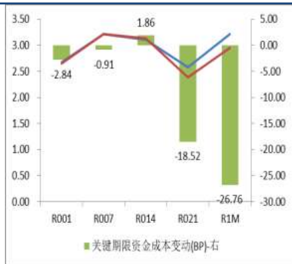
图 3：关键期限资金成本变动